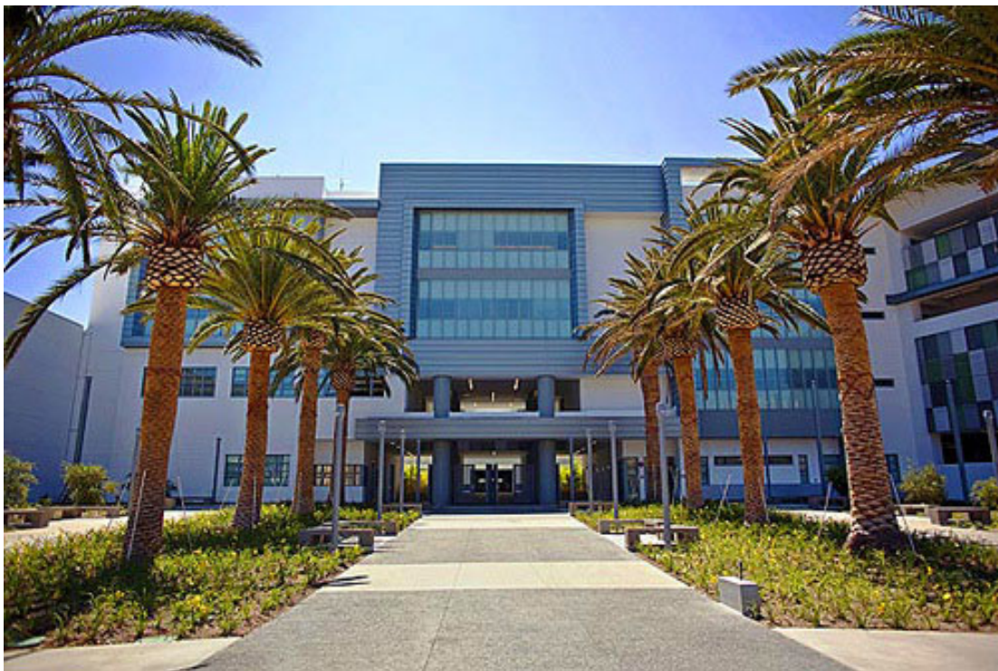
RFK Community Schools