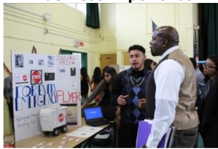
Experiencia de negocios