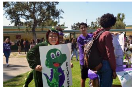
Kiwins Service Club / Club de Servicio Kiwins