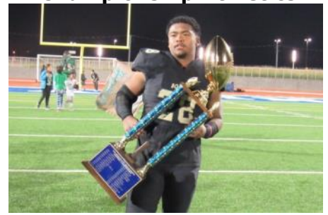
Campeonato de atletismo