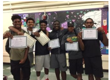
Atletas estudiantes de College Bound