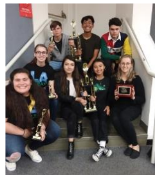
Equipo ganador del premio Debate