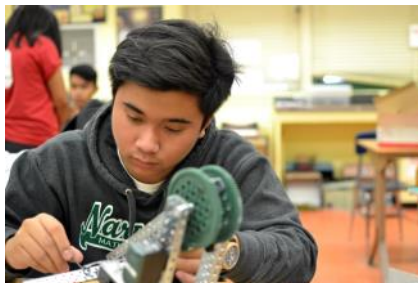
Robotics Class / Clase de Robótica