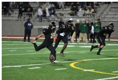
Champion Football Team/ Equipo de Fútbol Americano