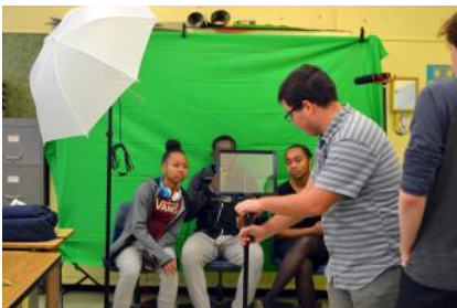
Film Making Class / Clase de Cine