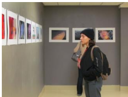
Arte de calidad profesional